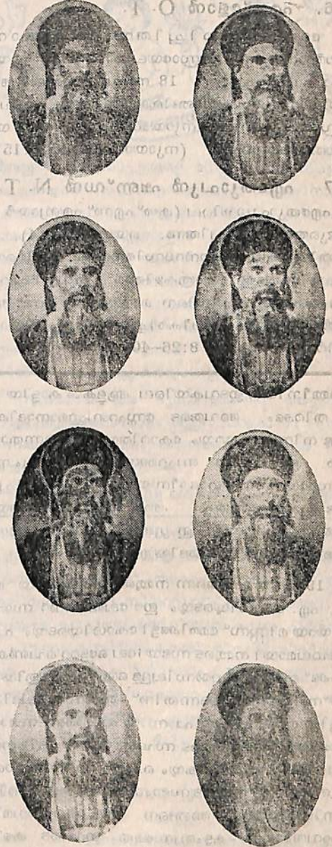
അനിയൻ ട്ര ഡെയ്സി, പാറന്ത.